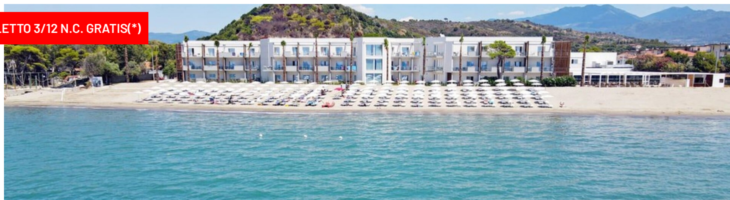
Quote settimanali per persona in camera Comfort Vista Parco in Pensione Completa