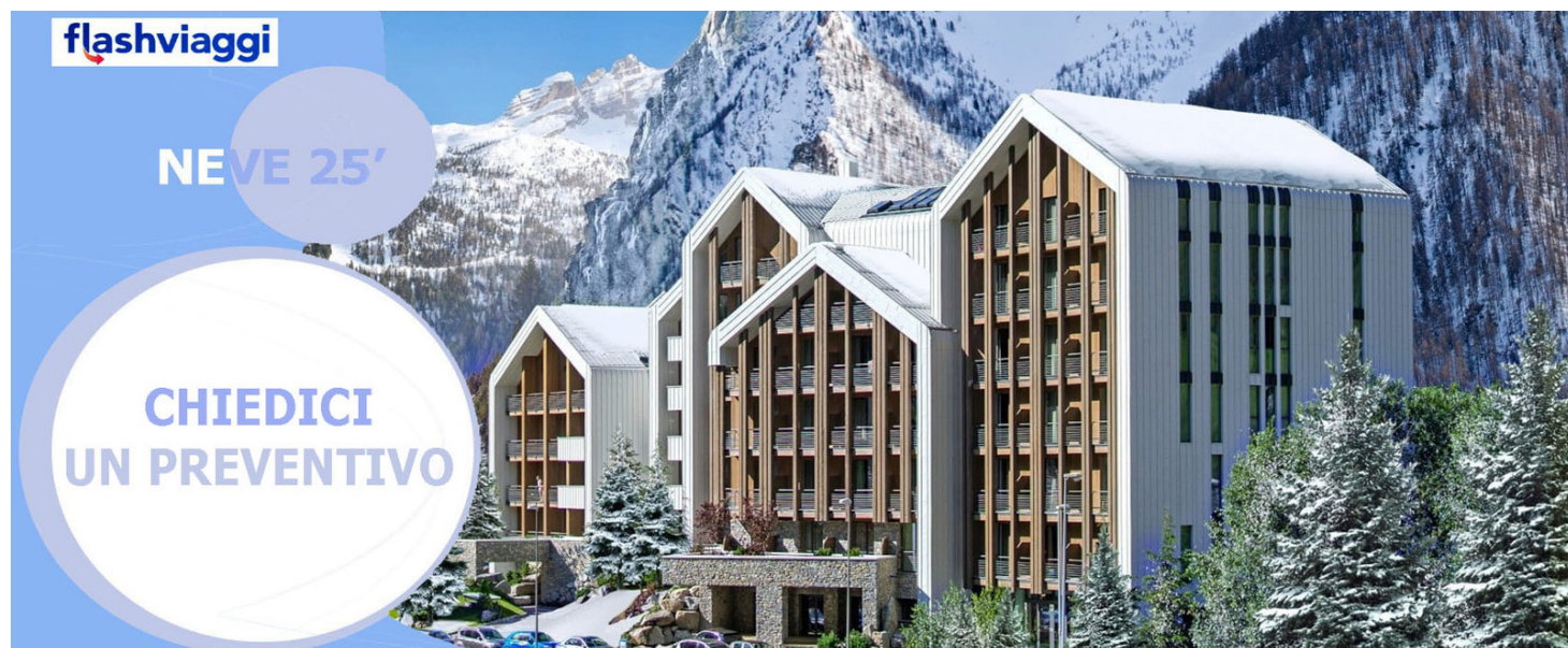
TH Courmayeur - mezza pensione, bevande ai pasti escluse